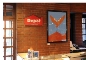
<赤レンガ [デポ] 店舗イメージ>