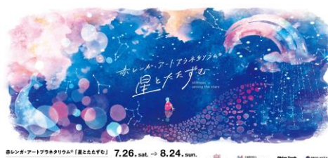
イベントキービジュアル

2021年と2023年の開催で大好評をいただいた体感型のアートプラネタリウム®が、さらにバージョンアップして開催！プラネタリウム・クリエイター大平貴之の提唱する新たな表現手法「ハイパー・ルミナンス」によって、夜空の星や灯台の一際キラめく輝きを再現します。