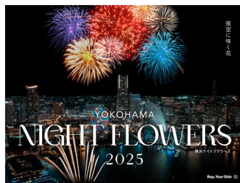
イベントキービジュアル