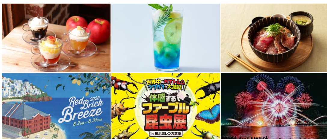
<横浜赤レンガ倉庫 夏グルメ・スイーツ・ドリンク イベントイメージ>

横浜赤レンガ倉庫では、2号館のレストラン・フードコート・カフェ各店にて、暑い夏の時期にぴったりな“さっぱり”フードメニューや、火照った身体を冷やしてくれる“ひんやり”スイーツ・ドリンクが登場いたします。ここでしか食べられない“横浜赤レンガ倉庫限定”の特別メニューにもご注目ください。