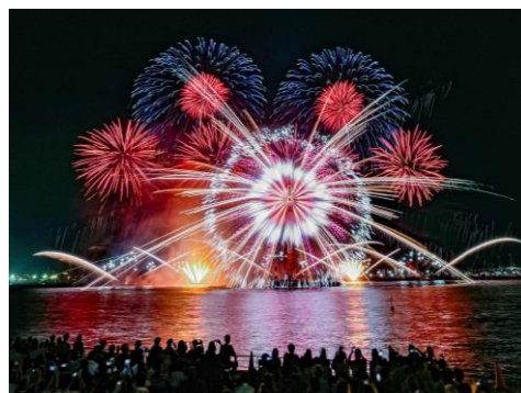
イベントキービジュアル