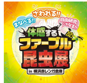
イベントキービジュアル

生きたカブトムシと存分にふれあえるエリアや、ヘラクレスオオカブトを“ナデナデ”できるフォトスポット、フンコロガシのパワーを体験するコーナー、合計 100 点もの世界中の昆虫の標本が集結した圧巻のライブラリーのほか、アンリ・ファールの生家の再現展示など、昆虫の奥深さ・面白さを全身で体感する事ができます。この夏も横浜赤レンガ倉庫で、昆虫と遊びつくそう！