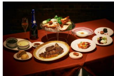
＜コースメニューイメージ＞

Re : Wharf の代名詞でもある US プライムビーフ T ボーンステーキがメインのコース