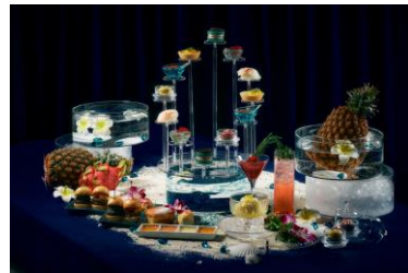
＜夏限定アフタヌーンティー イメージ＞

また、この夏限定の煌びやかなアフタヌーンティーや、夏野菜・夏のフルーツを使った爽やかなランチメニューなど、夏を感じる限定メニューもご用意。“大人の贅沢”を堪能できる特別な空間の中で、大切な人とお食事をお楽しみください。