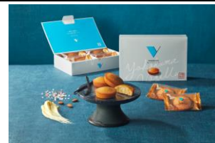
<塩バニラフィナンシェ 商品イメージ>

今年 5 月より、1 号館 1F「赤レンガ [デポ]」にて期間限定で販売していた横浜発ギフトスイーツブランド「横浜バニラ」ブランドのフラッグシップ商品『塩バニラフィナンシェ』を 6 月 16 日（月）より同店舗にて常設販売することが決定し、店頭で販売しております。 みなとみらいエリアでの常設販売は、横浜赤レンガ倉庫のみ となります。横浜の新定番土産として注目されている商品となるため、ぜひこの機会にお立ち寄りください。